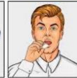
Umístěte ho za horní ret